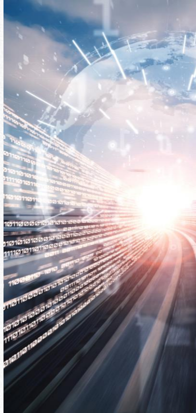
En tiempo real

La comunicación con Hacienda podrá realizarse mediante dos procesos.